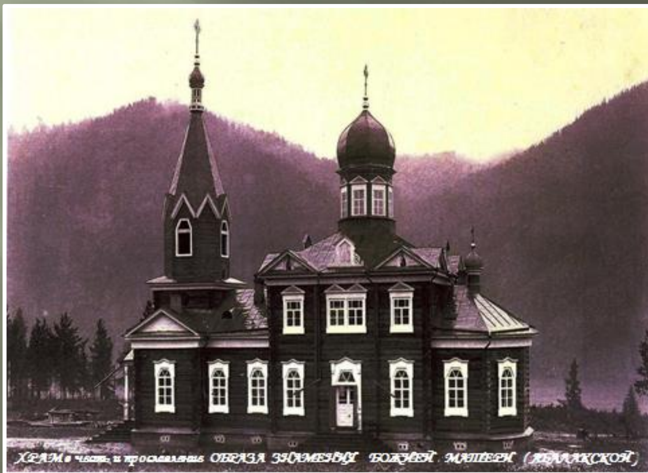
ХРАМ в честь и прославления ОБРАЗА ЗНАМЕННОЙ БОЖЬЕЙ МАТЕРИ (ДЕВЯТСКОЙ)