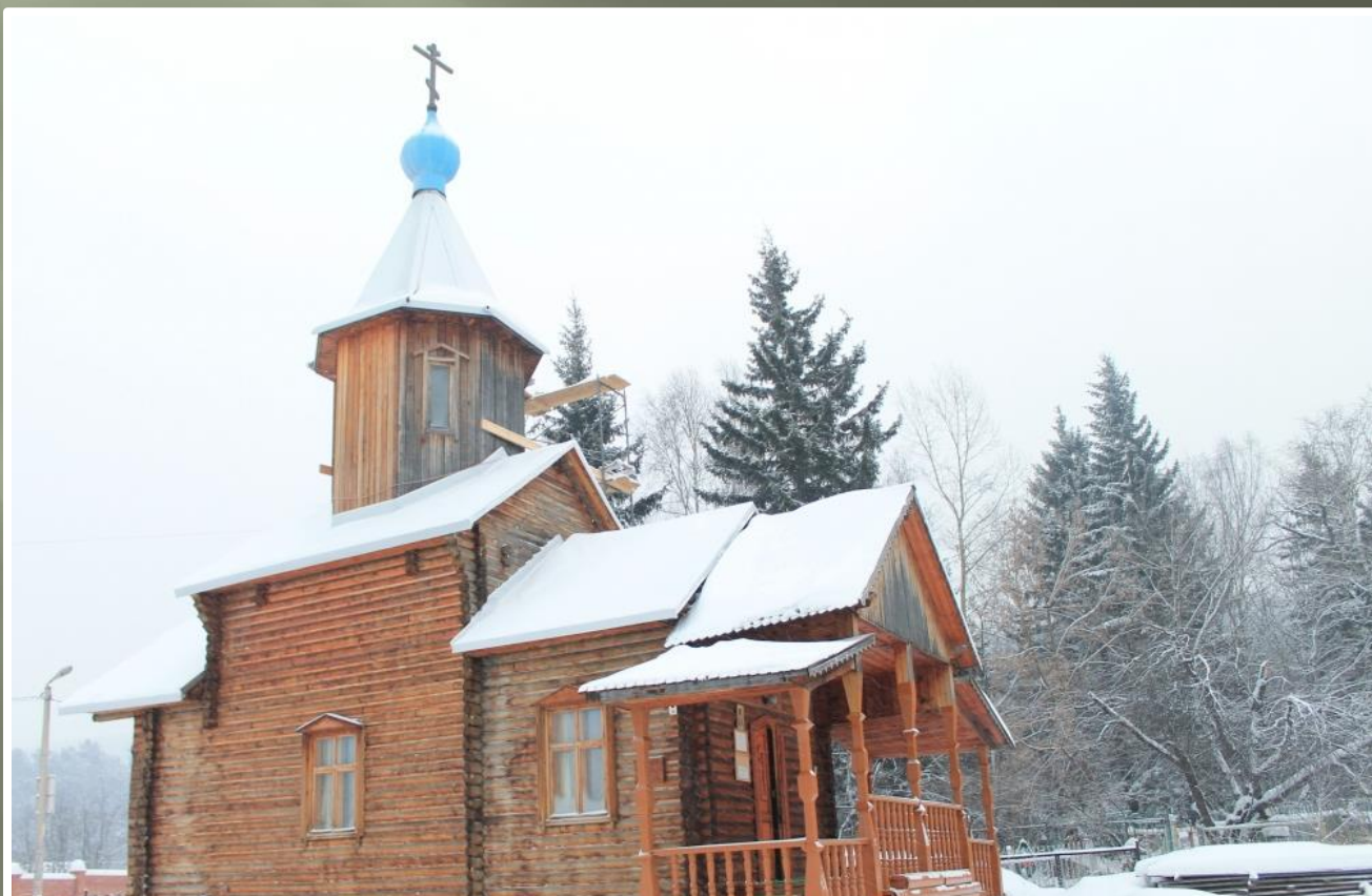
ХРАМ ИННОКЕНТИЯ ЕПИСКОПА ИРКУТСКОГО С. ОВСЯНКА