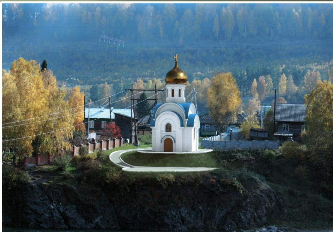
ХРАМ ПОКРОВА ПРЕСВЯТОЙ БОГОРОДИЦЫ ПОСЕЛОК УСТЬ-МАНА